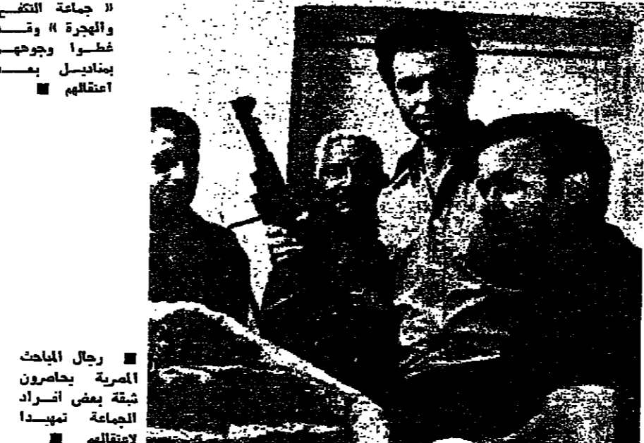
رجال المباحث المصرية يحاصرون شقة بعض أفراد الجماعة بمدينة لاقتلهم

الضربة او المعامل لجراء التجارب العلمية .. ومقاومة الاجامات المادية باستخدام العنف . وعاش سبيل المال ، سحلت محاصر مكاتب الابن بجماعة القاهرة واقعة اعتداء بعض العناصر الارهابية على استاد جميلي لانه رفض تخصيص اماكن للثبية وامكان للطالبات ، ودعا الى جلوس جميع الطلبة في المدرجات . وسجلت ايضا دعوة بعض اعضاء الجماعة لزملائهم بارتراد السري الخاص بهم وعدم تقبل المطالبات التي يريدون الصناديق او البطون .